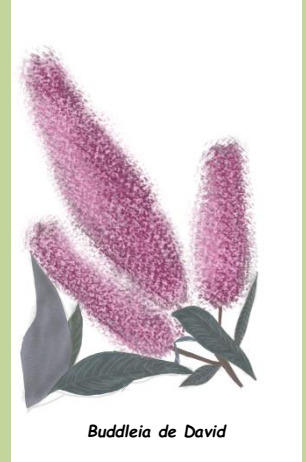
Buddleia de David

Le Buddleia produisant beaucoup de fleurs mais peu de nectar (sucre des fleurs récolté par les papillons), les papillons finissent surchargés de travail et épuisés sous le poids de leurs efforts non récompensés. Ce qui met leur vie en danger .